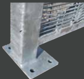
Platine 16 x 11 cm Trou de fixation ø 15 mm

STFECENT Entonnoir de remplissage Le remplissage varie de 10 € à 52 € le m 2 selon le type de pierre, concassé ou galet. u.* 78,00