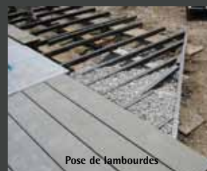
Pose de lambourdes

• Haute performance • Écologique • Robuste • Aspect chaleureux • Esthétique naturelle • Résistant à l'eau • Ne verdit pas • Facilité d'entretien • Sans écharde.